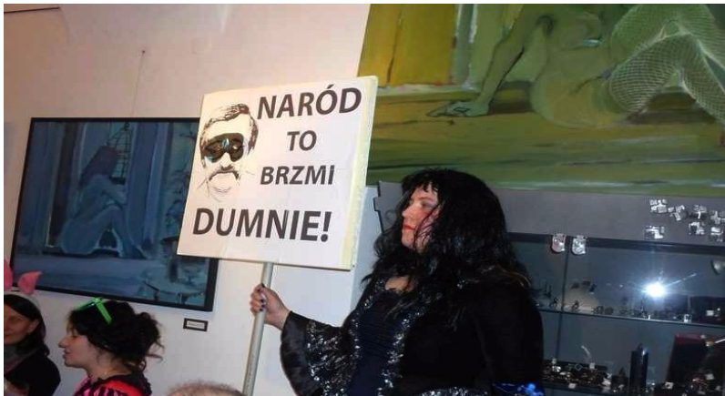
Purim 5776/2016 w Galerii Szalom