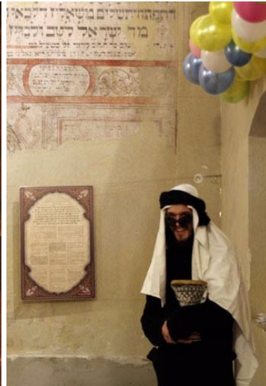
niezwykli goście purimowi | extraordinary purim guests