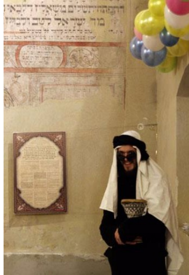
niezwykli goście purimowi | extraordinary purim guests